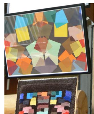
Modèle et échantillonnage